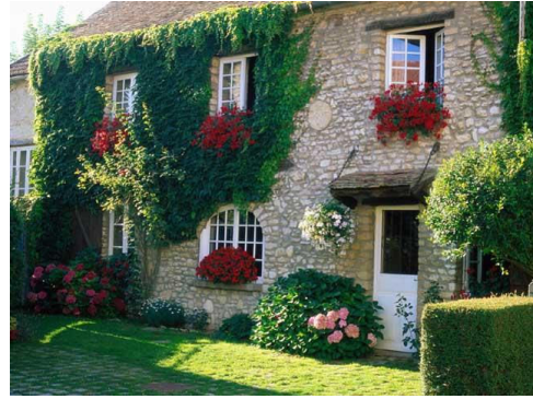
Résidences secondaires : atout majeur pour le tourisme

Le tourisme occupe en France une place majeure : plus de 2 millions d'emplois, près de 7,5% du PIB, environ 10 milliards d'euros de contribution à la balance commerciale. Liée en grande partie au patrimoine des territoires (naturel, paysager, culturel, industriel, urbain...), cette activité repose plus que d'autres sur une étroite coopération public-privé et, plus largement, sur la mobilisation de ses multiples acteurs : collectivités et satellites, Etat, opérateurs, associations et, de plus en plus, consommateurs [8]. "Le cœur des territoires bat donc au rythme du tourisme..." . L'économie territoriale privilégie traditionnellement deux approches.