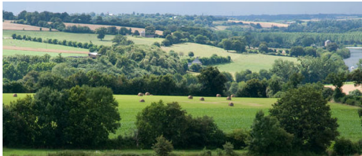
Le Boischaut Sud de l'Indre

Notre étude confirme les différents travaux présentés dans cet article : les touristes sont attirés en Brenne et Boischaut pour profiter des paysages ruraux et des derniers espaces naturels préservés, flore, faune, qui ont échappé à l'urbanisation et à l'artificialisation des terres.