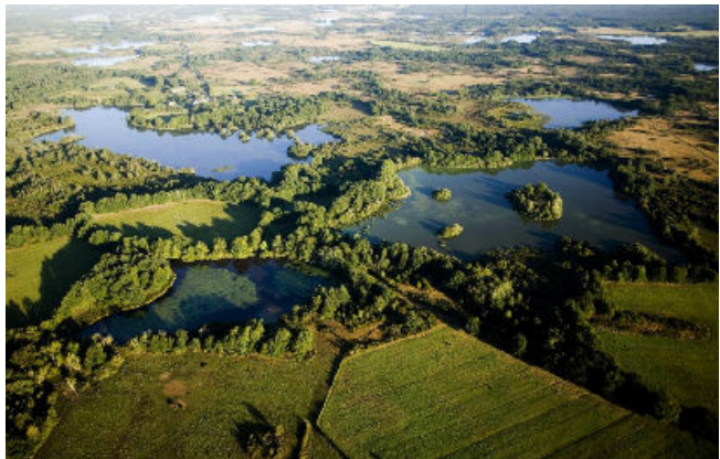
La Brenne des étangs

En effet, que les paysages d'une destination changent brutalement, et c'est tout un secteur touristique qui risque d'être ébranlé, parce qu'une destination perd l'une de ses ressources importantes, parce que l'image promotionnelle ne montre plus la réalité de la destination ou, encore, parce que les touristes ne rencontrent pas – ou plus – ce qu'ils sont venus chercher [3], [14].