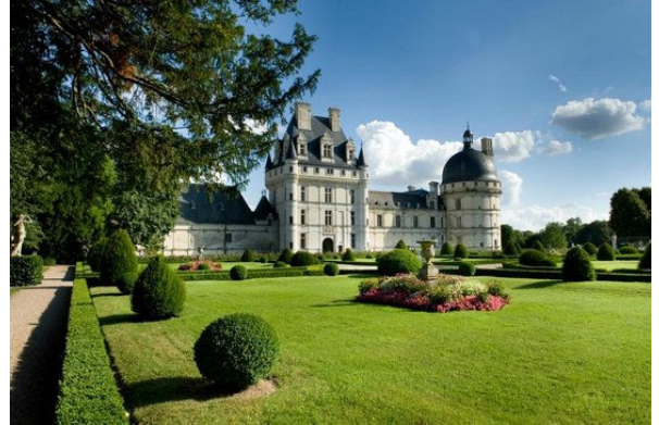
Château de Valençay

Enfin, cette contribution vise à préciser les attentes des acteurs liés au tourisme et les besoins qu'ils engendrent au regard des politiques d'aménagement du territoire et des services publics, de valorisation de l'environnement ou encore du cadre de vie.